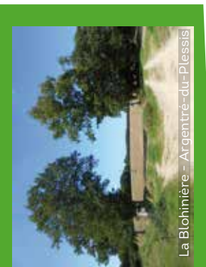
La Blohinière - Argentré-du-Plessis