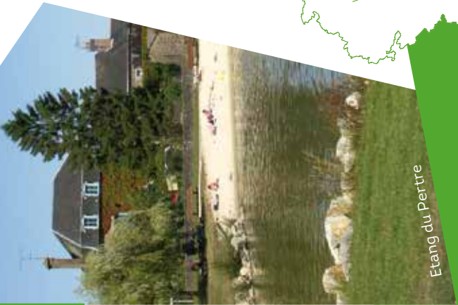
Etang du Pertre